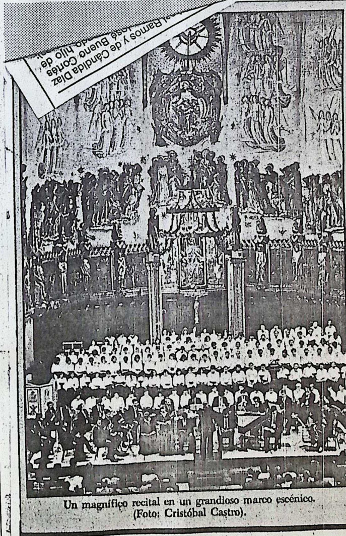
Un magnífico recital en un grandioso marco escénico. (Foto: Cristóbal Castro).

El Retaule Artístic de Terrassa alcanzó un enorme éxito de organización, al celebrar, el domingo, su concierto de Montserrat, en la Basílica del Sant Esperit. Cuatro coros de Vilafranca, Terrassa, Sabadell y Vic, secundaron a excelentes músicos y solistas vocales, en la ejecución de «La pasión, según San Juan», compuesta por Juan Sebastián Bach. El templo presentó un lleno prácticamente antológico. En la presidencia de honor, el presidente de la Diputación y el alcalde de la ciudad, acompañaron al conseller Oriol Badia. (Información en página 9).