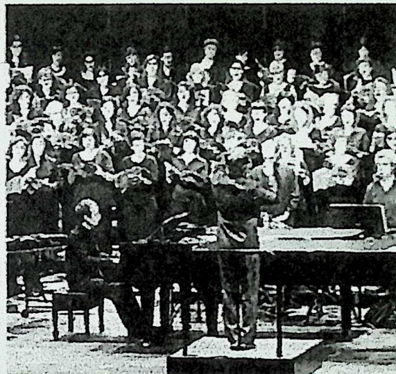
El concert va entusiasmar el públic, que va exhaurir les localitats MIREIA ARSO

El projecte de la Coral de l'Eix, que uneix entitats musicals de les ciutats per on passa l'eix transversal, és format per l'Orfeó Manresà i les corals Ginesta de Cervera, Canigó de Vic, Regina de Manlleu, Cabirol de Vic i la coral infantil Nova Cervera. La coral va estrenar el muntatge el mes de febrer passat a l'Auditori de Barcelona i el concert de Manresa formava part d'una sèrie d'actuacions que els ha portat a diferents poblacions que uneix l'eix transversal.