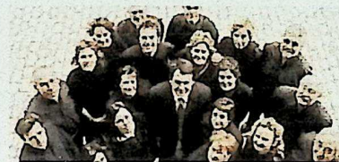
Coral Canigó de Vic